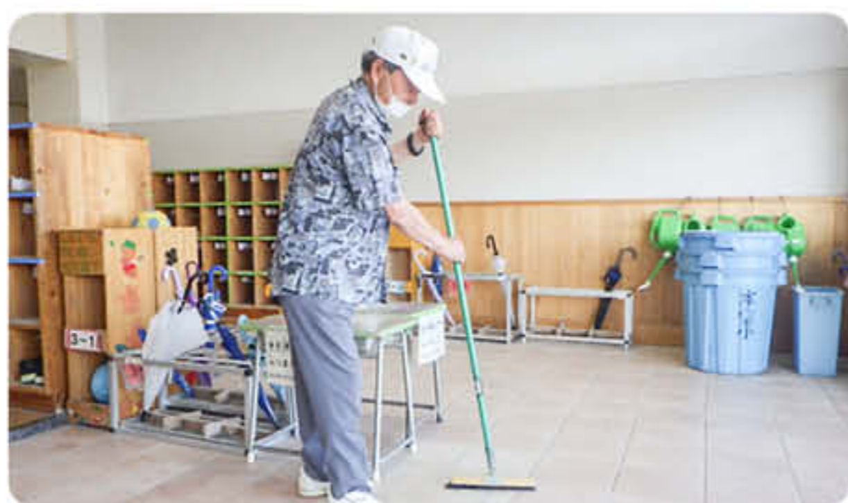
◆ 本宿学童クラブ児童誘導員 ◆

児童誘導員は放課後、発注者から依頼のある平日に、本宿小学校と本宿第二学童クラブとの間の横断と、校庭で遊ぶ子供たちの安全を見守っています。