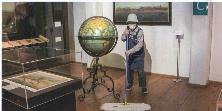
週2回半日程度オランダ商館の清掃をしています。

平 戸市シルバー人材センターでは、次のような仕事の依頼を受付けています。会員登録をご希望の人や、作業のご依頼は、平戸市シルバー人材センターまで、お気軽にご連絡ください。