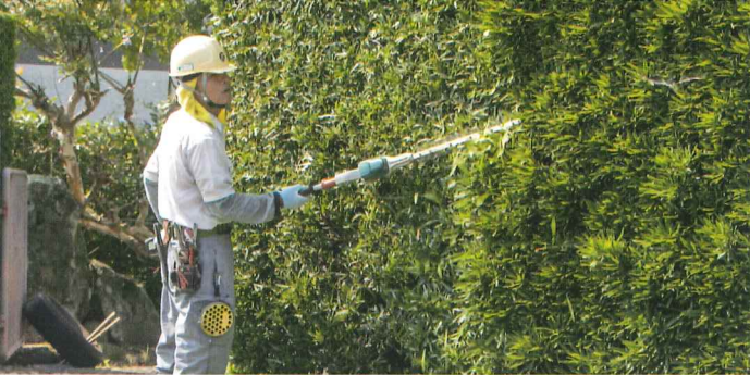
特技を生かして剪定作業を担当しています。