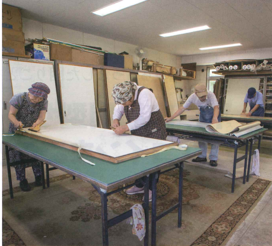
襖の張り替えは、入会後に先輩会員に習いました。