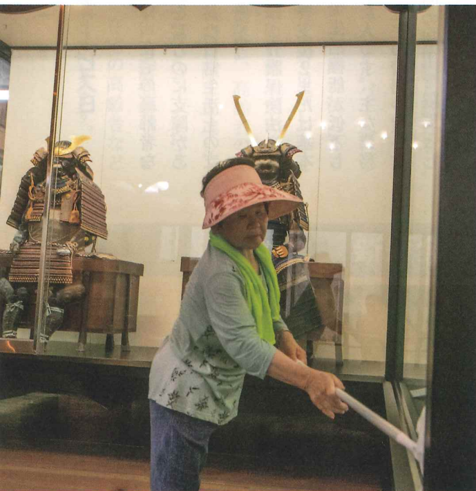
松浦史料博物館は女性6人が輪番で清掃しています。