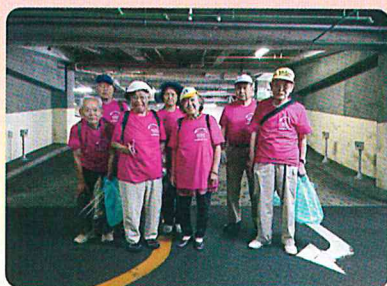
高齢者同好会「万年青会」による 「七夕まつり市民ボランティア」 令和元年 7月5日 (金) 平塚駅周辺 8人参加

事業団では、地域社会への貢献と事業団の存在を広く市民の皆様にご存知いただくため、ボランティア活動を実施しています。ボランティア活動を通じて、会員は生きがいの充実や健康の維持増進、参加者との交流を深めています。