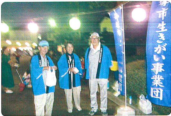
盆踊り会場の伊勢山公園で事業団PRのティッシュを配った松が丘班

モデル地区設置から16年が経過した現在、地区班では会報等の文書配布のほかにも事業団PRやボランティア、親睦行事などを実施しています。班活動の具体的な計画は総会で審議されるため、活動に対する会員間の理解と協力は欠かせません。また、円滑な班運営を実現するため、各班では班の中に10人前後の連絡網グループを構成しています。連絡網グループには班活動の世話をする連絡委員が設置され、会員が順番に連絡委員を務めるなど継続的な活動に向けて協力し合っています。