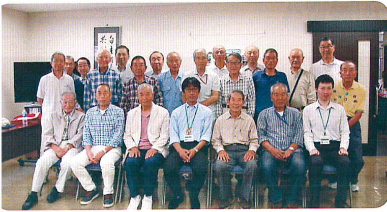
地区班長連絡会議の出席者。班員からの要望や意見の協議、事業団の方針、情報などを周知する

事業団は就業のイメージが強いですが、収入が目的ではなく、地域の高齢者たちが自主的に助け合いながら働くとうとする生きがい（福祉）の充実を目的としています。また、生きがいは与えられるものではなく見つけるものであることから、事業団は会員の総意と主体的な参画によって運営される開かれた組織でなくてはなりません。そのため、事業団には未就業であっても活