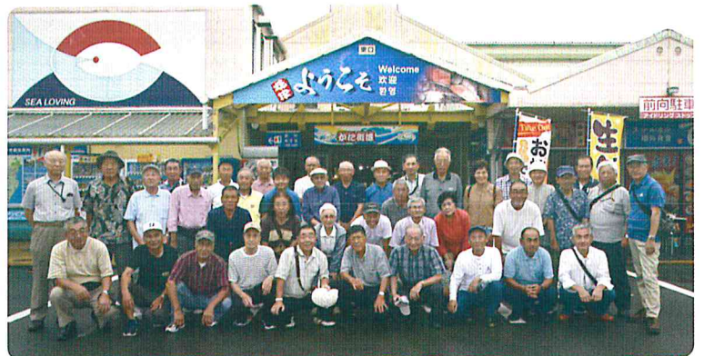
会員親睦会主催の焼津バス旅行。案内チラシは連絡委員が配布し42人が参加した

地区班が単なる連絡網にならないようにするには、班活動を通じて事業団の理念を会員に浸透させることが肝要です。