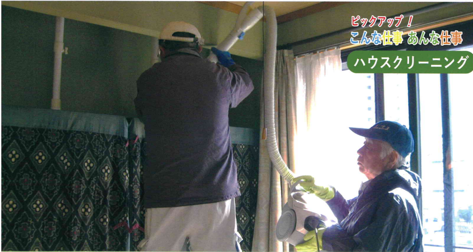
ピックアップ! こんな仕事 あんな仕事 ハウスクリーニング

結びに、事業団のますますの発展と皆様のご健勝を祈念いたしまして、新年のご挨拶とさせていただきます。