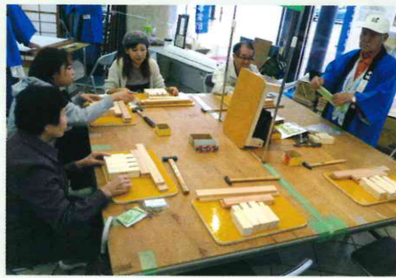
大工班「玄関踏み台作り」