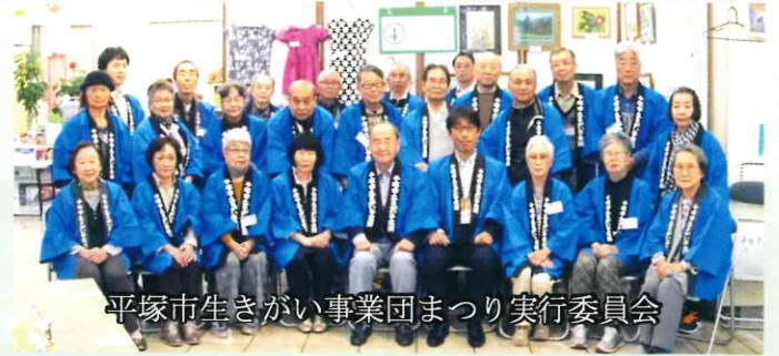
平塚市生きがい事業団まつり実行委員会