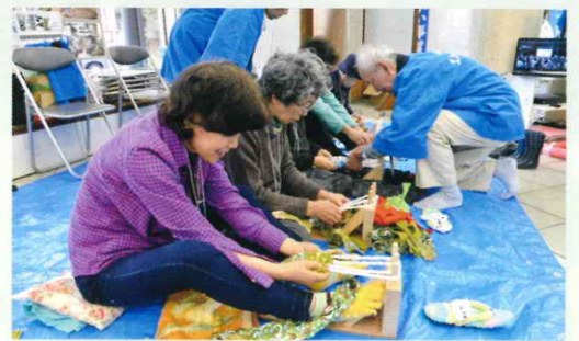
万年青会「布わらじ作り」