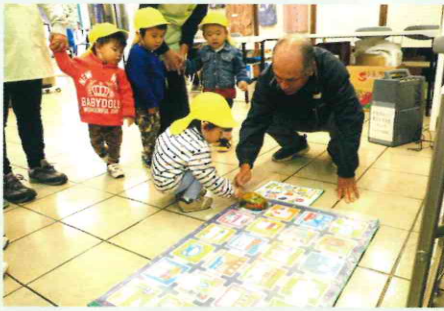
IT班「プログラミングカー体験」