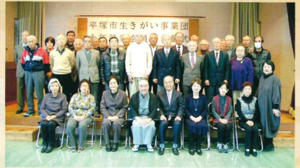
勤労会館での表彰式（出席会員34人）