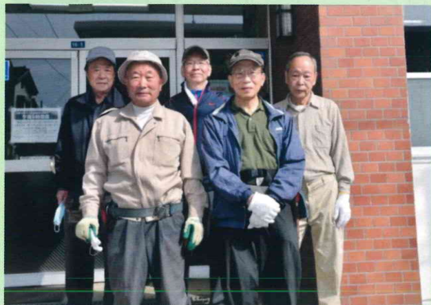
南原公園／5人（公民館職員1人含む）／令和3年3月30日（火）