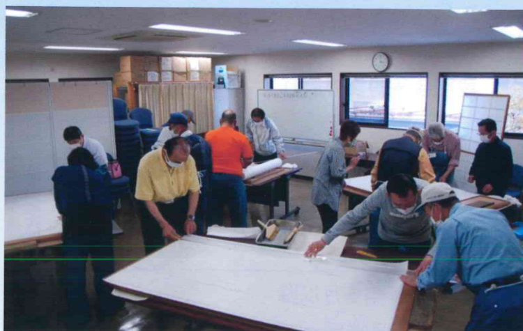
障子張替え講習／令和3年4月20日（火）