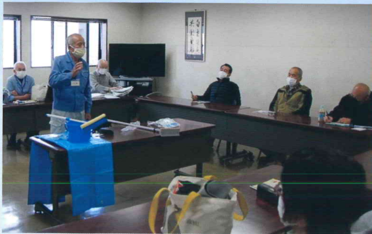
窓ピカピカ講習／令和3年3月23日（火）

入会後の就業を具体的にイメージできるよう、会員登録説明会に合わせて「窓ピカピカ講習」と「障子張替え講習」を開催しました。講師を務めたのは、一般家庭で窓ガラスの掃除をするライフサポート班と、襖や障子の張り替えをする襖班で働く会員です。就業に活かせる講習の開催により、参加者の入会を促進しました。