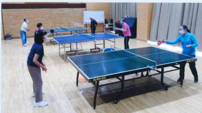
大野公民館／8人／令和3年4月25日（日）

公民館の利用条件に合わせて卓球を行っています。コロナ禍で運動機会が減っているため、楽しみに参加してくれる人が多いです。勝負よりも健康増進が目的のため、未経験者歓迎です。