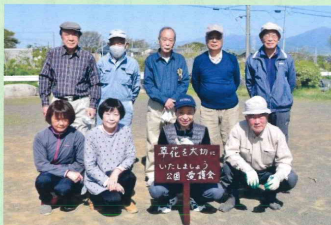
南原公園／9人（愛護会4人含む）／令和3年4月11日（日）