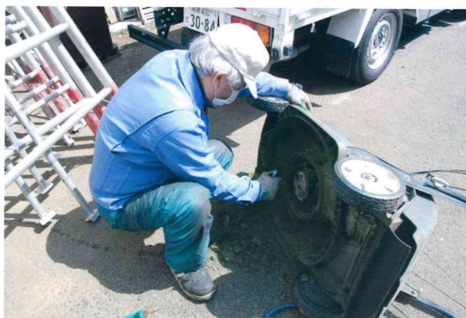
芝刈機の土詰まり除去