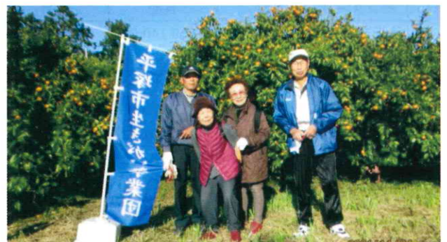
大磯町「杉崎農園」／4人／令和3年11月24日(水)

金目班のお誘いで、みかん狩りに行きました。金目班が利用しているみかん園は、小粒で甘いみかんが食べられるため、毎年楽しみにしています。お土産用のみかんもたくさん持って帰ることができ、大満足の日でした。