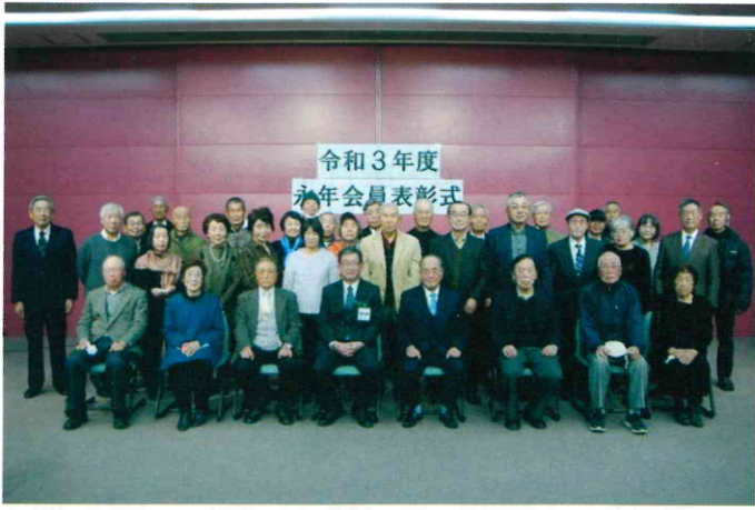
美術館での表彰式（出席会員34人）

会員が積み上げてきた安全で質の高い就業の仕方は、新会員が仕事を始める際には見本となります。これからも長年培ってきた経験を活かし、就業環境の整備や新会員への助言など、事業団の発展に向けてご協力をお願いいたします。