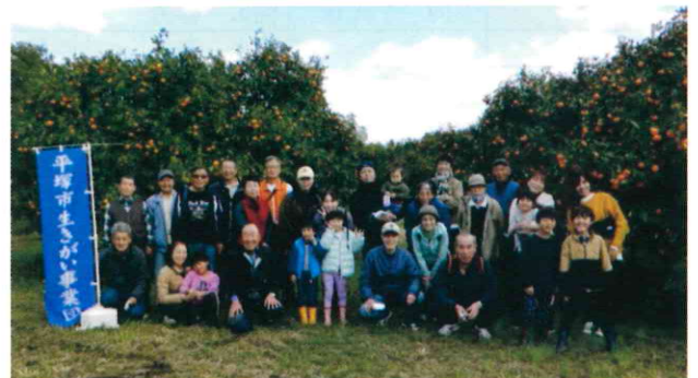
大磯町「杉崎農園」／42人／令和3年11月23日(火)

今回も「勤労感謝の日」に計画しました。前日の雨で心配していましたが、当日は快晴に恵まれ、楽しいひと時を過ごせました。参加者はみかんを食べて、お土産も大量に持ち帰りました。