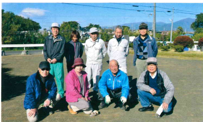
南原公園／9人（愛護会5人含む） 令和3年11月14日（日）