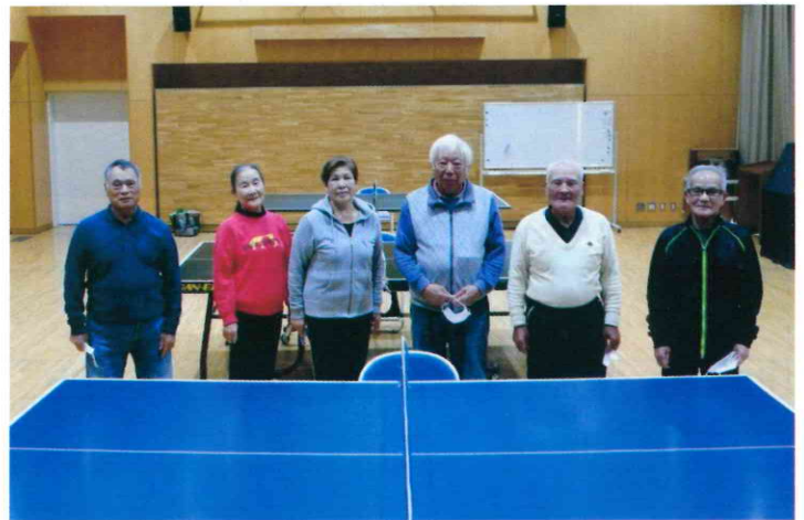
大野公民館／8人／令和3年11月28日(日)