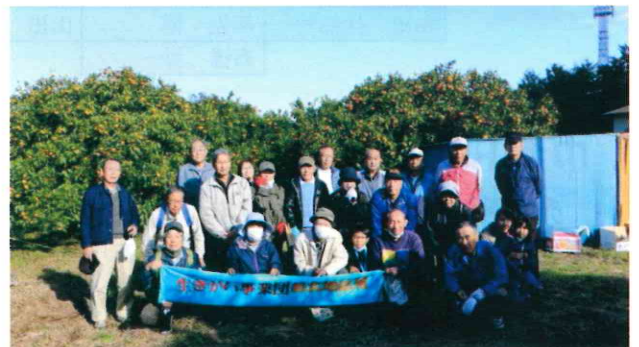
大磯町「杉崎農園」／24人／令和3年11月23日(火)

前日はかなりの雨で心配でしたが、当日は朝から素晴らしい天気でした。参加者は公民館に集合し、車7台に分乗しました。みかんは大変甘く、全員夢中で食べ、たくさんのお土産を持って帰路につきました。