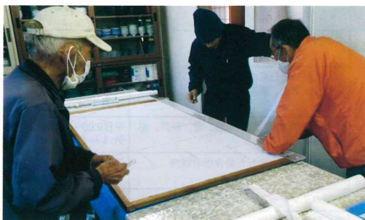
豊田公民館／4人／令和3年12月19日（日）