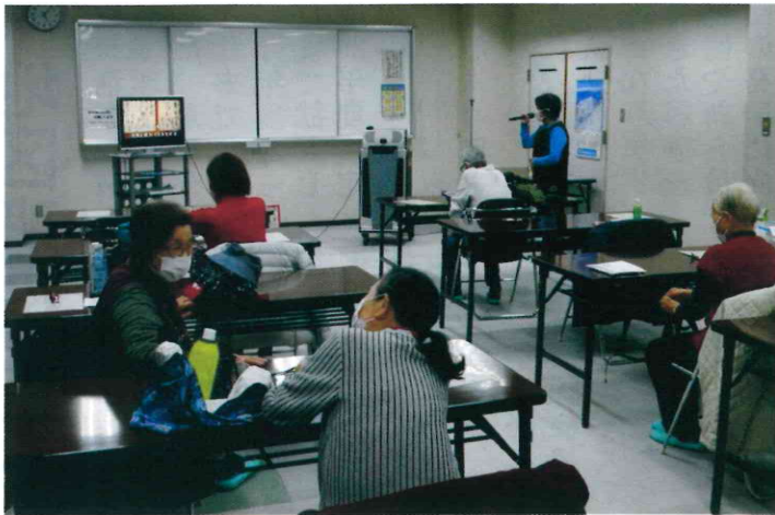
四之宮ふれあいセンター／8人／令和3年11月27日(土)

毎月、班の行事でカラオケと卓球を行っています。カラオケは最後の土曜日午後5時～6時30分、卓球は第2・第4の日曜日午前9時～12時です。時間内であれば自由に入退室できますので、参加したい方はお越しください。初めての方は手ぶらでも参加できます。