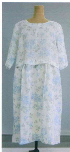
ワンピース（夏着物） 11,000円