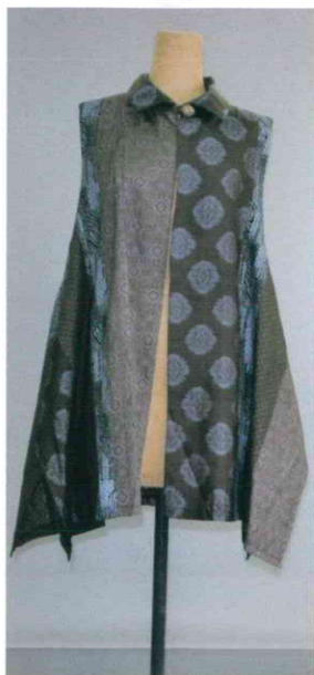
変形ベスト（大島紬） 9,900円