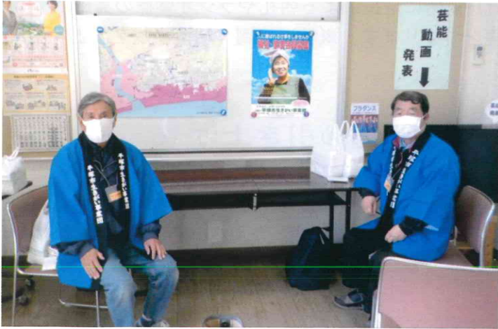
浜岳班 なでしこ公民館 事業団のPRと防災マップの展示を行いました。

※新型コロナの状況により、前号（2022.1.20発行101号）でご案内したとおりに参加できませんでした。