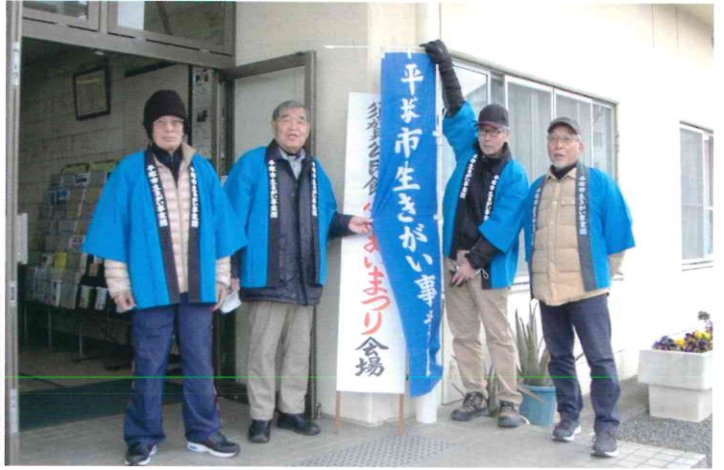
港班 須賀公民館 チラシやティッシュを配布し、事業団のPRを行いました。