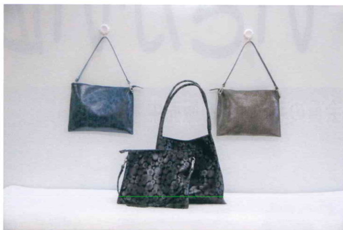
(左・右) バッグインバッグ各2,500円 (中央) ハンドバッグセット8,000円