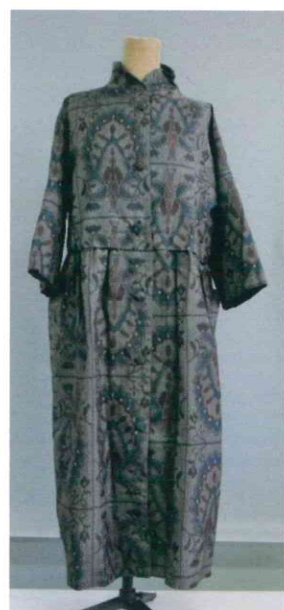
ワンピース（大島紬） 12,100円