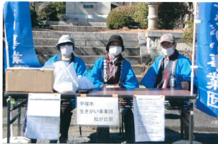
松が丘班 松が丘公民館 チラシやティッシュを配布し、事業団のPRを行いました。