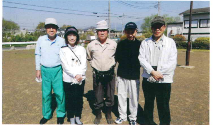
南原公園／5人／令和4年4月10日（日）