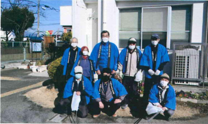
横内公民館・小学校・子どもの家周辺／9人／令和4年2月12日（土）