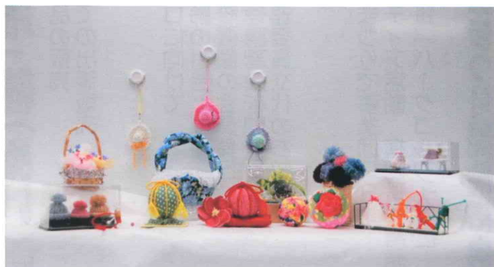
帽子キーホルダー、毛糸の子犬・帽子・花など 100円～700円