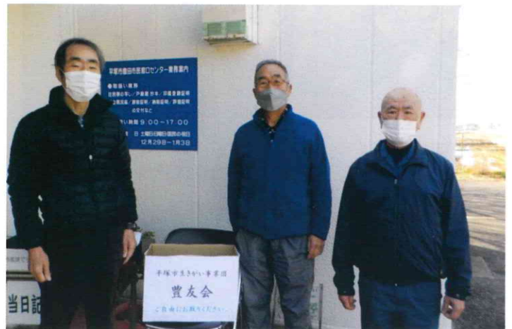
豊田班 豊田公民館 チラシやティッシュを無人配布し、事業団のPRを行いました。