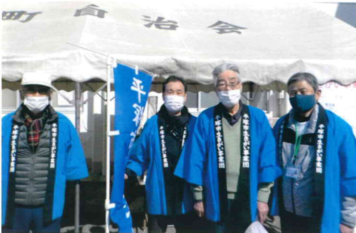
八幡班 八幡公民館 チラシやティッシュを配布し、事業団のPRを行いました。