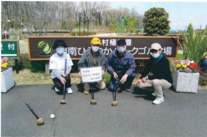
湘南ひらつかパークゴルフ場／4人／令和4年3月28日（月）