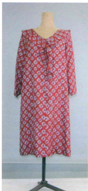
ワンピース（総絞り） 9,900円