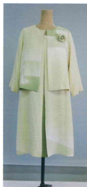
アンサンブル（付け下げ） 18,700円