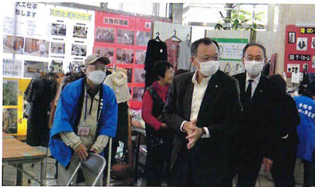
市長・副市長の訪問