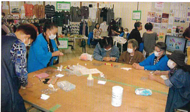
かわいいわんちゃん作り体験