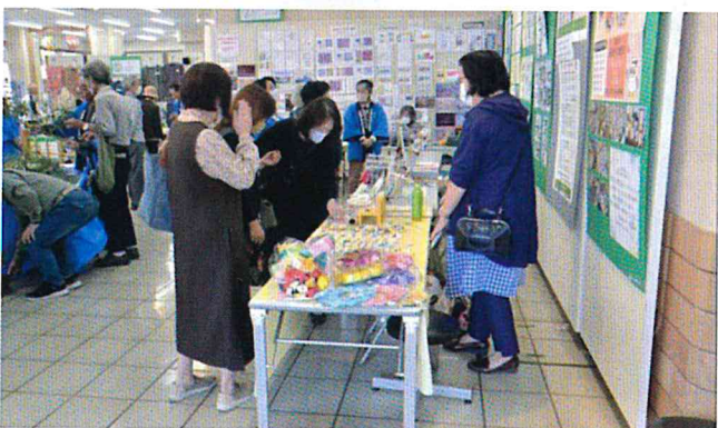
刺しゅう作品の販売