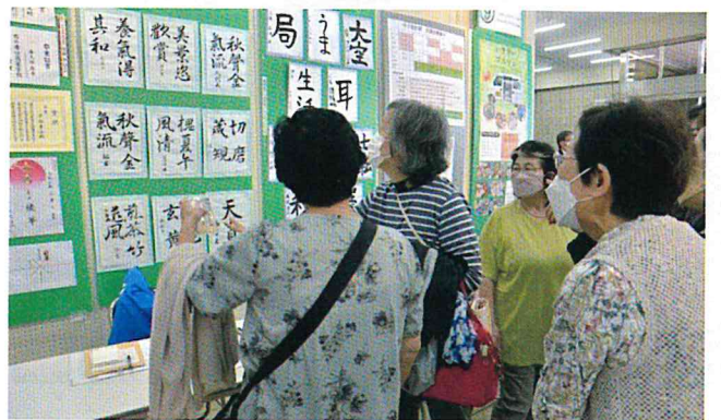
書道教室のパネルの見学