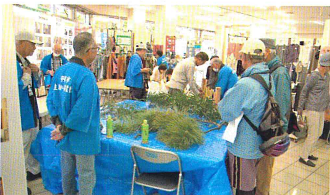
植木せん定の実演