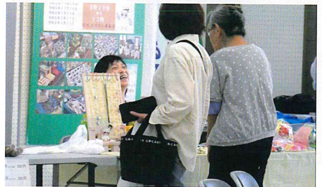
手作りアクセサリの販売