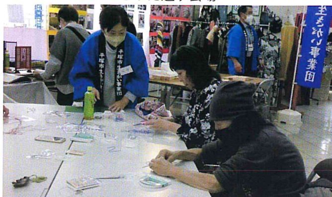
ミニ帽子作り体験