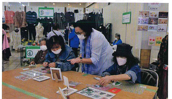
クリスマス刺しゅう体験