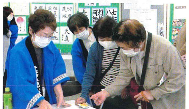
折り紙コマ作りの体験