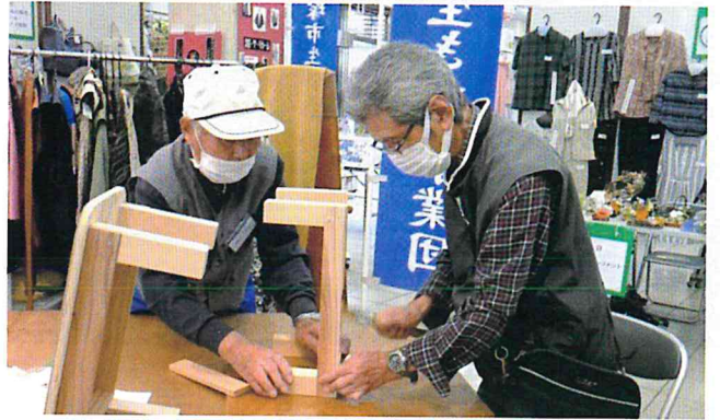
玄関踏み台作り体験