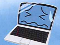
パソコンなんでも相談

会場：ひらつか市民プラザ 主催：平塚市生きがい事業団まつり実行委員会 後援：平塚市