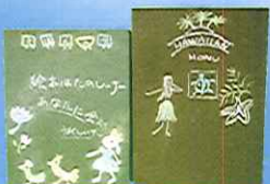
チョークアート教室