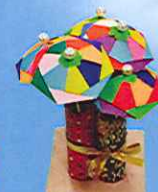
折り紙ミニ傘作り