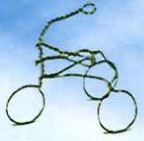
針金アート 「三輪車作り」