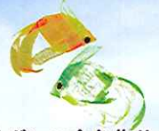
リボンの金魚作り