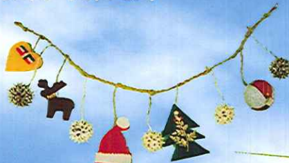
クリスマスの オーナメント作り