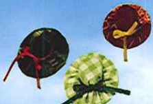
ミニ帽子ブローチ作り