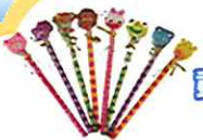
動物消しゴム 付き鉛筆