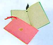
メッセージカード作り