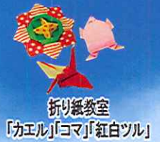
折り紙教室 「カエル」「コマ」「紅白ツル」