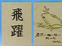
ポストカードのプレゼント