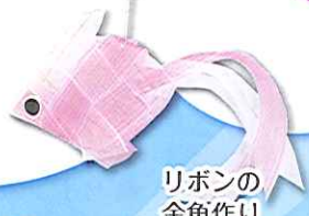
リボンの 金魚作り