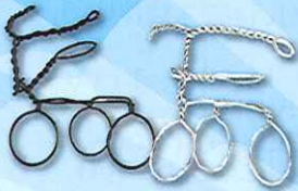
針金アート 「三輪車作り」