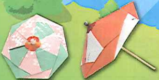
折り紙ミミ傘作り