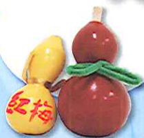
ひょうたんお絵かき