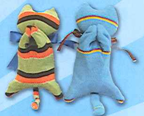
癒しのネコキャッチ作り