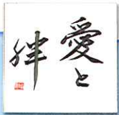
筆書き色紙の プレゼントくじ