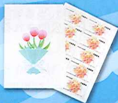
ワードお絵かき・名刺作り