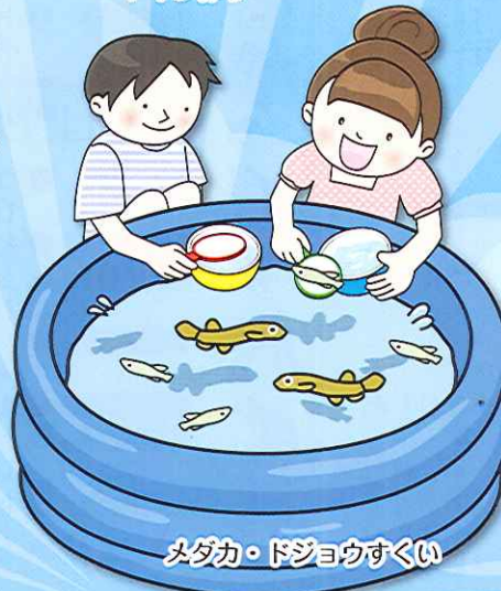
メダカ・ドジョウすくい