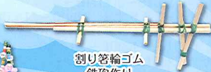
割り箸輪ゴム 鉄砲作り