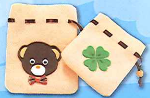
フェルトポーチ作り