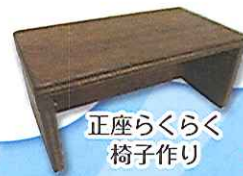
正座らくらく 椅子作り