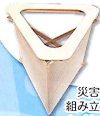
災害用 組み立て式 トイレ作り