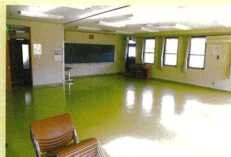
研修室・軽作業室 (2階)