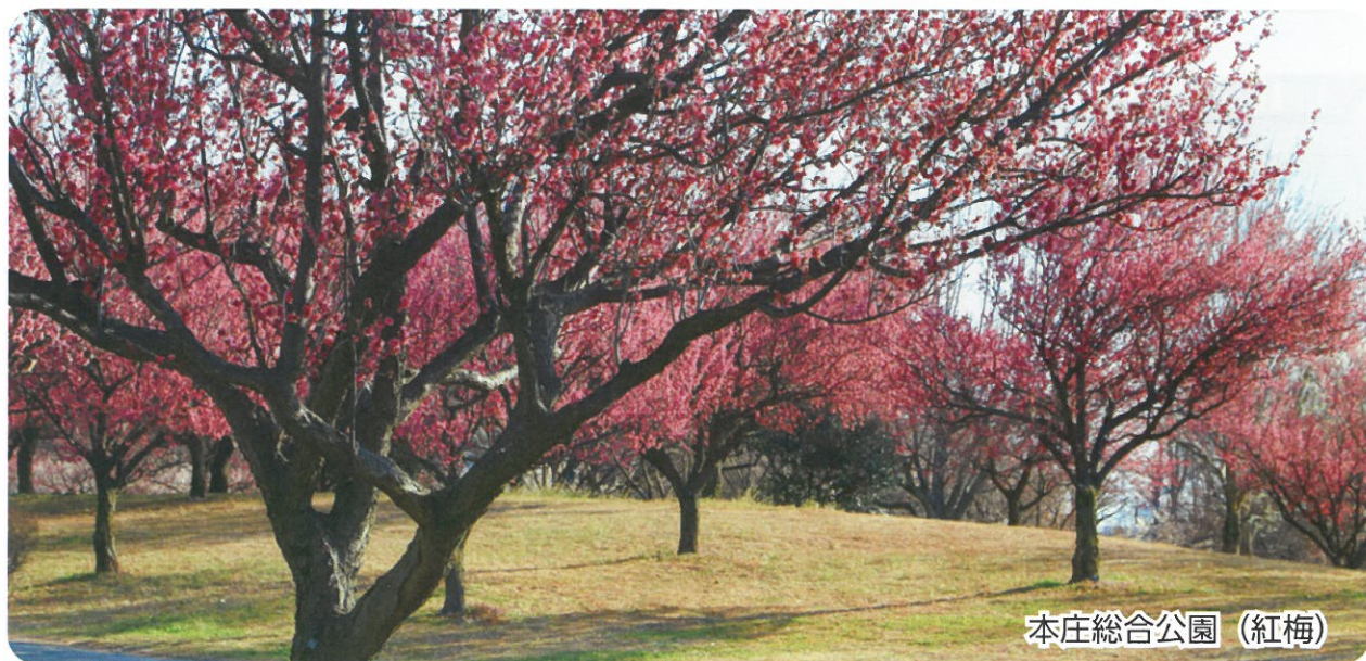
本庄総合公園 (紅梅)