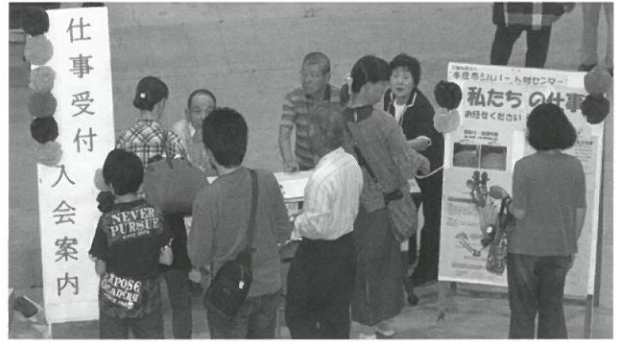
入会案内・仕事受付