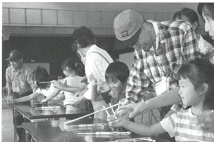
借遊びコーナー割りばし鉄砲