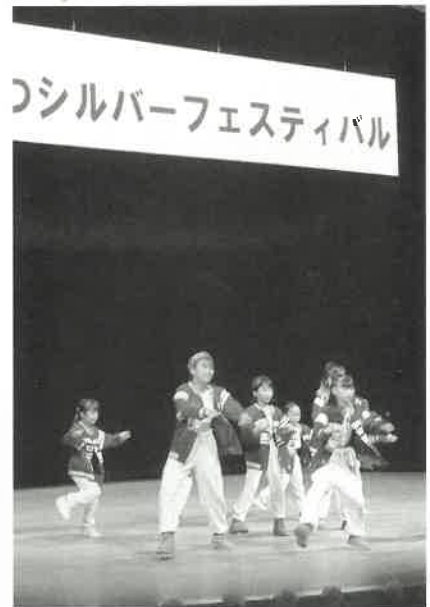
本庄ジュニアダンスサークル