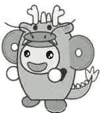
本庄市マスコット「はにほん」