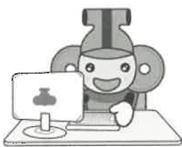
本庄市マスコット 「はにぼん」