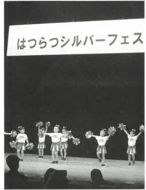
Ama Cheer dance team