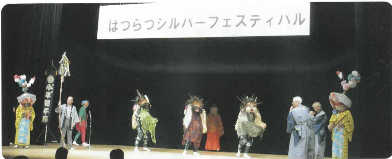
小平獅子舞保存会