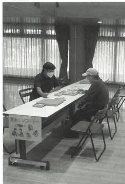
昔あそびコーナー