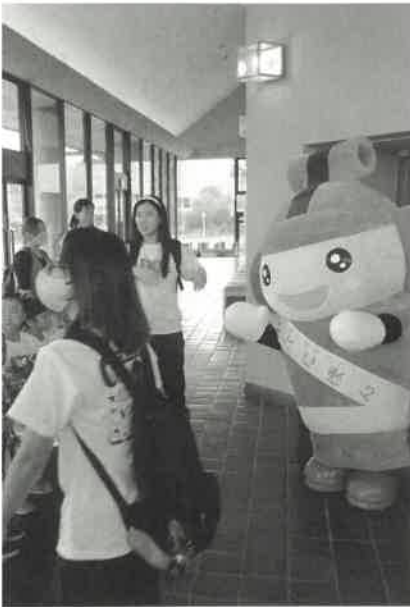
はにぽんと撮影コーナー