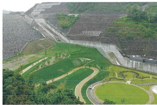
吹き下ろす風とせせらぎが心地良い憩いのエリア「風の丘ゾーン」