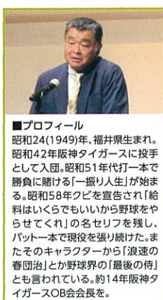
■プロフィール 昭和24(1949)年、福井県生まれ。昭和42年阪神タイガースに投手として入団。昭和51年代打一本で勝負に賭ける「一振り人生」が始まる。昭和58年クビを宣告され「給料はいくらでもいから野球をやらせてくれ」の名セリフを残し、バット一本で現役を張り続けた。またそのキャラクターから「浪速の春団治」とか野球界の「最後の侍」とも言われている。約14年阪神タイガースOB会会長を。

られて川藤幸三氏が登壇しました。講演では、川藤氏が初めて野球にかかわったきっかけから、高校時代の精神的成長のためお寺へ日参をしたこと。阪神入団時の調印エピソードや、契約金で親孝行をするはめになった話、またプロとしての苦労談や裏話にユーモアを交えて聴く人をひきつけました。最後に、その場で挙手で壇上上がった5人とのディスカッションでは、タイガースへのむつかしい質問にも、とめていねいにデータ分析と自分の思いを込めて答えられていました。アンケートの結果、15人の入会希望者と4人の入会があり、大成功の企画でした。