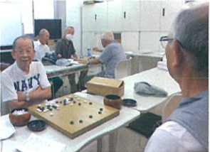
対局中の同好会メンバー

参加は、自分の体調、仕事などを調整し気楽に参加いただければと思います。 なお、不明な点は事務局にお問い合わせ