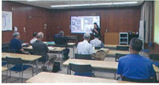
熱心に説明を聴く会員