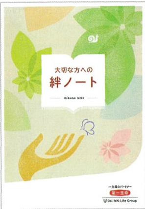
オリジナルの絆ノート(表紙)

◎日々、状況が変わったり、心に変化もあり、定期的にとか、思いついた折に、書き直すことも大切です。(橋本由紀子)