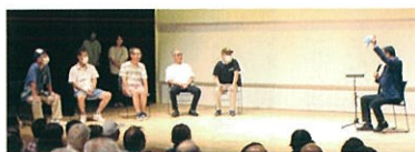
壇上でのディスカッション風景