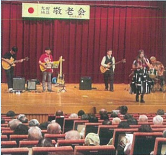
バンド演奏で大いに盛り上がった敬老会

9月13日に藍野大学ホールで開かれた太田地区敬老会にもバンド演奏で参加。なつかしのメロディーで来場されたお年寄りを大いに盛り上げました。