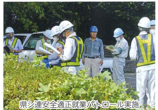
県シ連安全適正就業パトロール実施

また、元気に働き続けるためには、お住いの市町村が実施している健康診断は必ず受診して体調チェックをしましょう。持病を抱えながら働きたい方は、かかりつけ医に相談し、トラブルを避けるためにもセンターに事前に申し出るようにしてください。