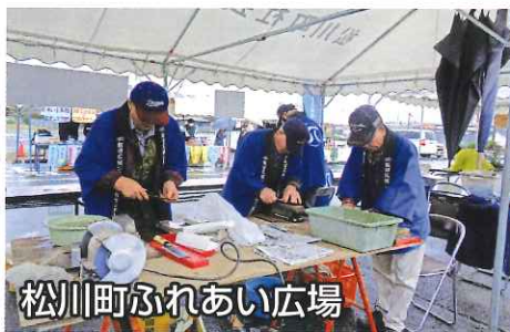
松川町ふれあい広場