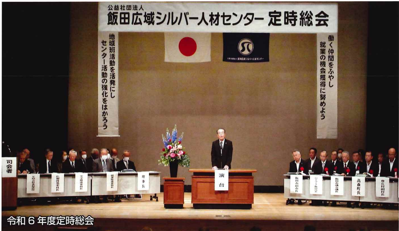
令和6年度定時総会

令和6年6月30日発行 (公社)飯田広域シルバー人材センター 飯田市鼎上山1890番地1 TEL:0265-22-8690 FAX:0265-22-8655 ホームページ: https://webc.sjc.ne.jp/ida/ E-mail: ida@sjc.ne.jp