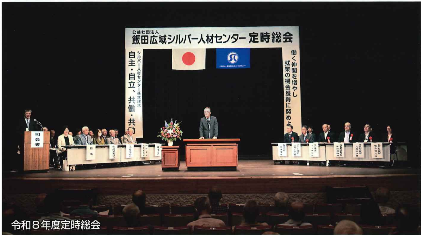
令和8年度定時総会

令和8年6月30日発行 (公社)飯田広域シルバー人材センター 飯田市鼎上山1890番地1 TEL:0265-22-8690 FAX:0265-22-8655 ホームページ: https://webc.sjc.ne.jp/ida/ E-mail: ida@sjc.jp