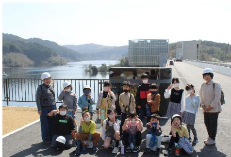
西柘植児童クラブ