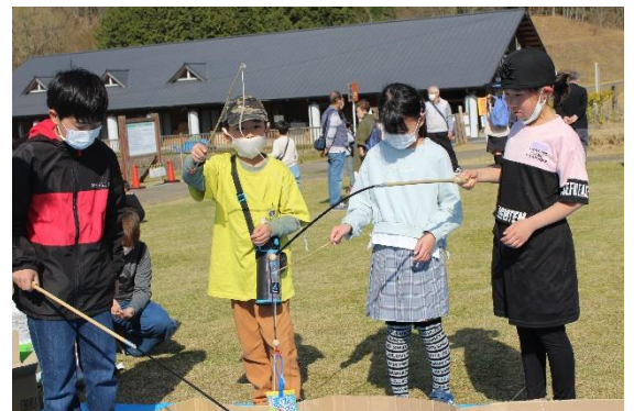
→ハーモニーフォ レストでお菓子釣 りを楽しみました