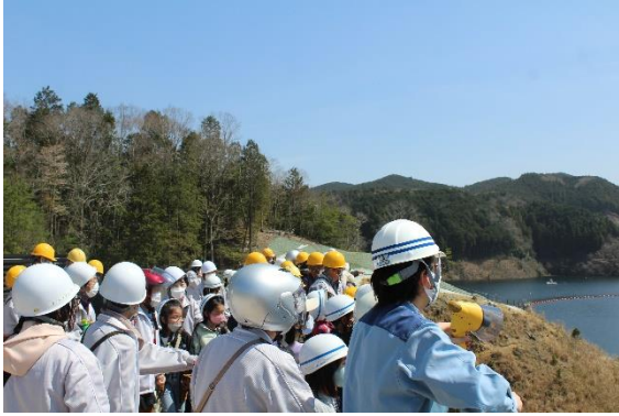
管理事務所屋 上からダム湖を 見学

建設中にも見学にお邪魔しましたが、大きなダムが完成したことに子供たちは、びっくり、興味津々でした。ダム見学後は、ハーモニーフォレストにてお菓子釣りを楽しみました。