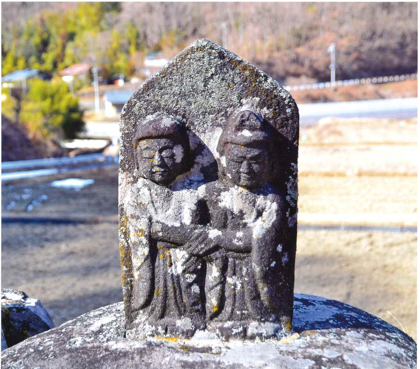
板山の道祖神(伊那市観光協会提供)