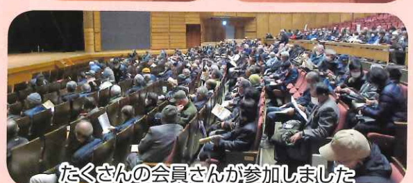
たくさんの会員さんが参加しました