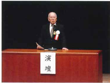
向山副理事長による挨拶

においても会員の方々が発注者の要望に応えるべく、自己管理を徹底し作業に携わってくれたことを誇りに思っています。徐々にコロナ前の活動に戻っていますが、これからも会員の皆様のご協力をお願いいたします。」との挨拶がありました。