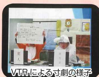
VTRによる寸劇の様子