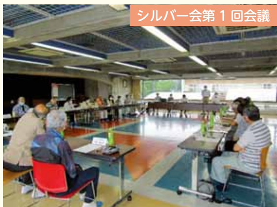
シルバー会第1回会議