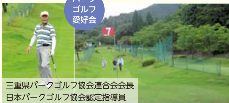
パークゴルフ愛好会