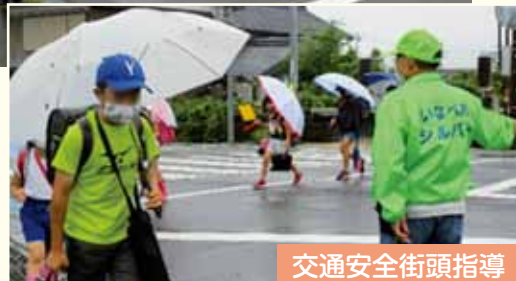
交通安全街頭指導