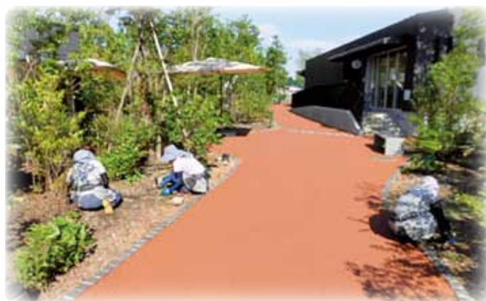
にぎわいの森での作業風景