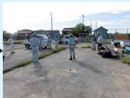
除草班草刈り現場にて朝礼風景