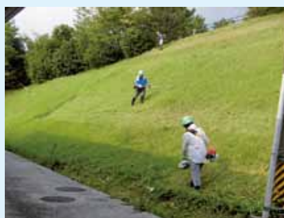
法面の草刈り作業中