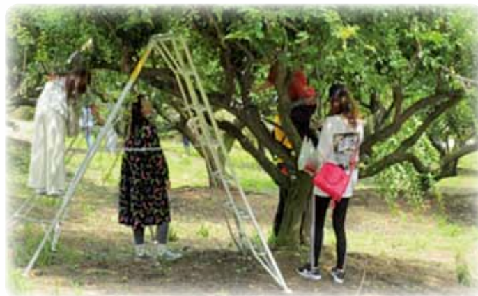
梅林公園の梅の実もぎとり風景