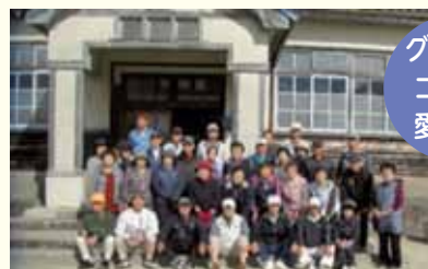
グランドゴルフ愛好会