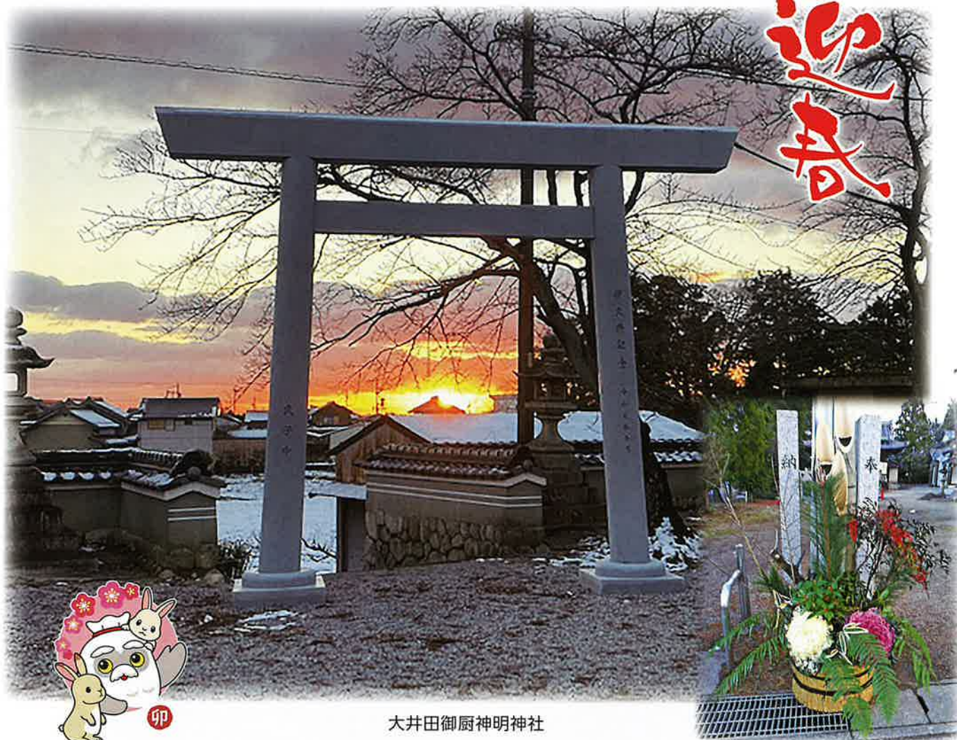
大井田御厨神明神社