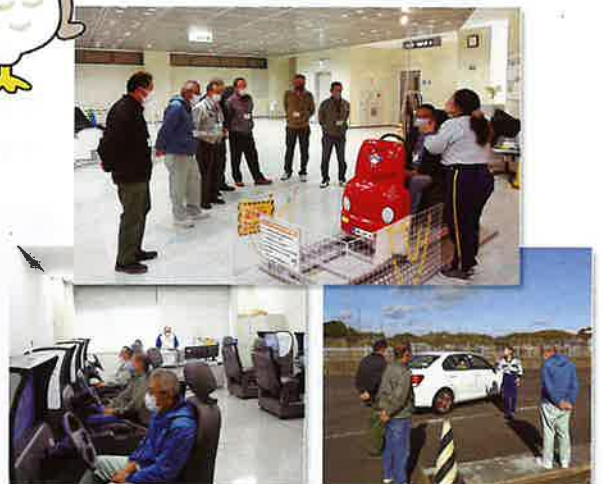
令和4年11月16日(水)に行われた交通安全マナー研修会