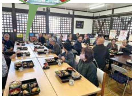
備品はすべてリサイクルを使用