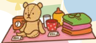
フリーマーケット