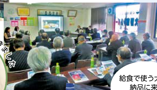
給食で使う大根を 納品に来た 会員さんとお話し