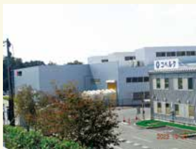
就業先のトヨタ紡織精工(株)様と(株)コベルク様

今後とも、いなべ市シルバー人材センターの皆様には当社へのご協力を期待すると共に、あわせて皆様のご活躍をお祈りしております。