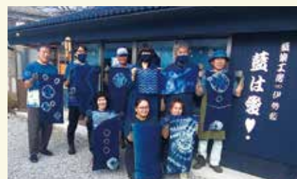
就業中のみなさん