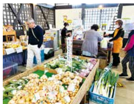
会員さんの育てた野菜や味噌の販売コーナー