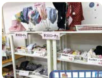
会員さんの 手づくり商品