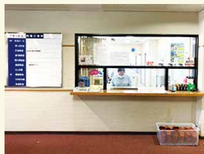
受付業務のようす