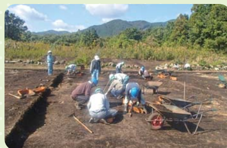
照光寺遺跡発掘調査(石樽南)