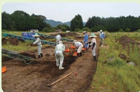
四辻遺跡発掘調査(向平)