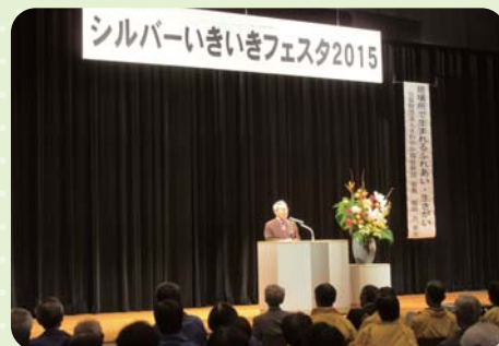
いきいきフェスタ講演会