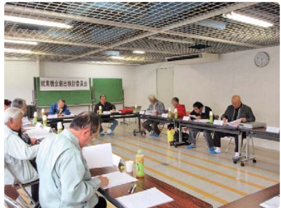
就業機会創出検討委員会