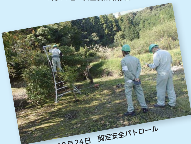
10月24日 剪定安全パトロール