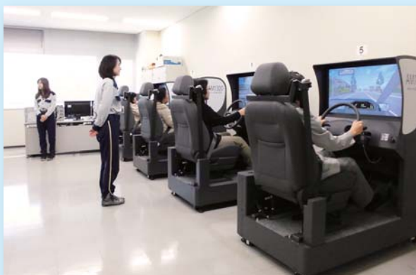
11月13日 交通マナー研修