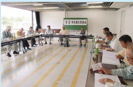
5月27日 第1回安全適正委員会

今年こそは、就業は安全確保最優先に徹して戴き無事故で乗り切り、そして充実した一年を皆様の人生に刻まれんことを衷心より祈念し、新年の挨拶とさせていただきます。