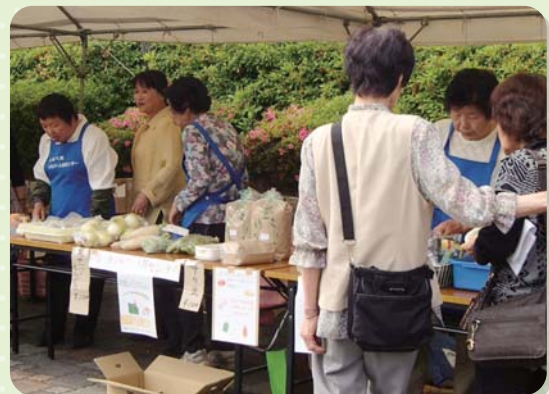
設立10周年記念 即売会