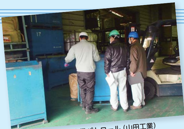
2月3日 企業パトロール (山田工業)