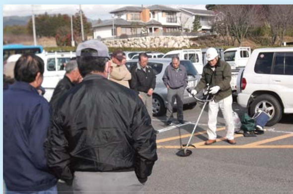
2月21日 刈払機講習会