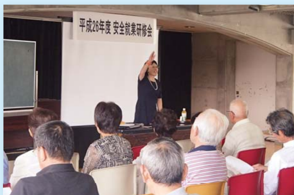
8月30日 安全就業研修会