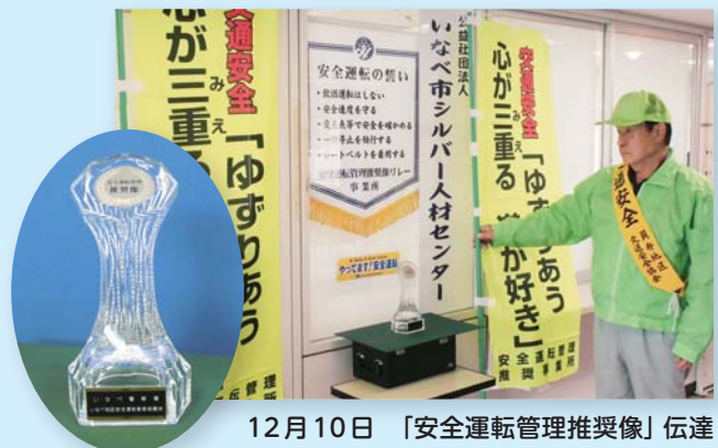
12月10日 「安全運転管理推奨像」伝達