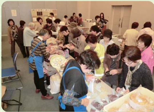
いきいきフェスタ2014