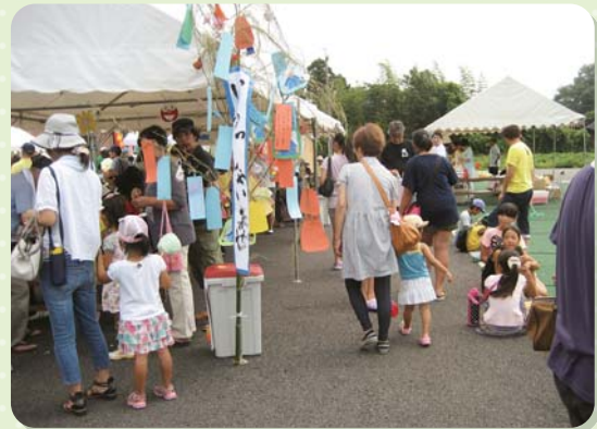
あじさいの家バザー