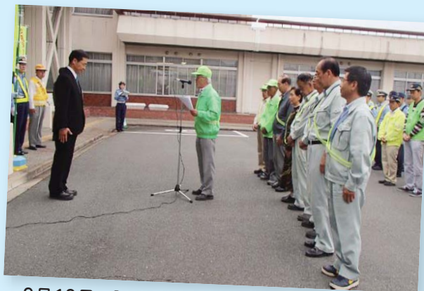
9月19日 「秋の交通安全運動」出発式 (安全宣言)