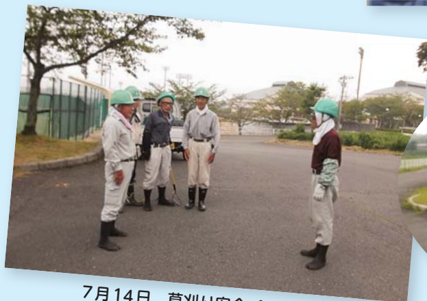
7月14日 草刈り安全パトロール