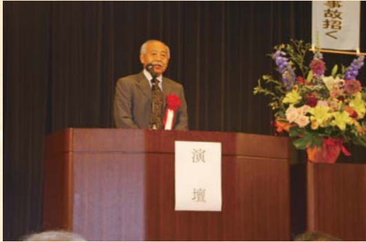
内田県シ連事務局長祝辞