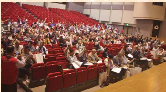
総会風景 (挙手多数で議案成立)