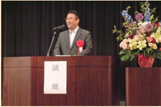
清水市議会副議長祝辞