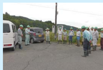
◀除草班畦草刈朝礼風景