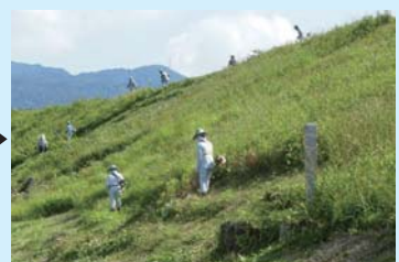
員弁町笠田大溜▶ 除草作業