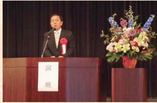
日冲県議会議員祝辞