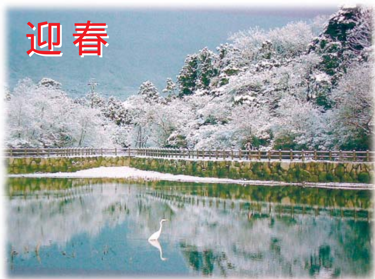
大安町鍋坂溜の雪化粧