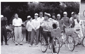
香西係長による模範演技