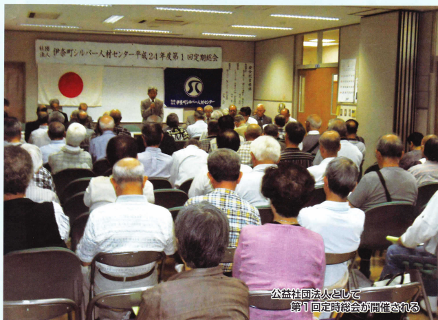
公益社団法人として 第1回定時総会が開催される

公益社団法人 伊奈町シルバー人材センター 〒362-0806 埼玉県北足立郡伊奈町大字小室5049-1(ふれあい福祉センター内) URL : http://business4.plala.or.jp/inasc17/ TEL 048-720-5911 FAX 048-723-8755