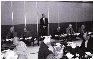
新年を迎えて理事長のご挨拶