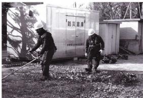
ベテランの草刈り班がマンツーマンで教えます