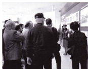
ガイドさんによるビール製造説明

11月8・9日の両日、岳温泉へ会員親睦旅行が行われました。途中、鶴ヶ城、ビール工場等にも立ち寄り見学をしました。天候にも恵まれ、楽しいひとときを過ごすことが出来ました。