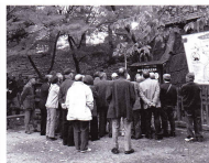
きれいな紅葉でした。