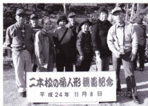
記念撮影をバチリ