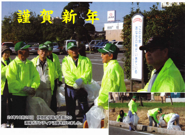
24年10月20日 伊奈町役場庁舎周辺の 清掃ボランティア活動を行いました。