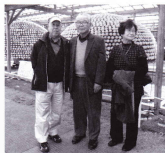
大きな菊づくりの前で