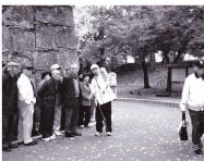
鶴ヶ城でのガイドさんの説明