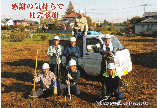
暑い夏も頑張る処理班のメンバー