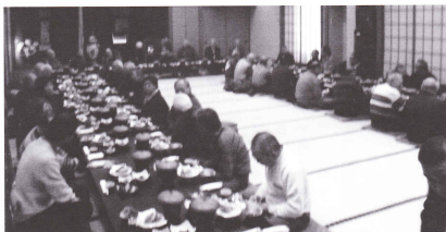
大勢の方々にご出席いただきました

平成26年度会員新年会が、2月9日（日）、白岡市の米屋において、野川町長、市川区長会長（顧問）