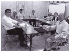
安全・適正就業委員会のメンバー一同

全国のシルバー人材センターで就業中に多数の方が事故等で亡くなっています。少しの気のゆるみが事故に繋がりますので、しっかりと安全就業に徹してください。