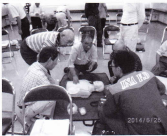
パットを貼る場所は？