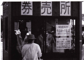
入場券の販売を担当しました