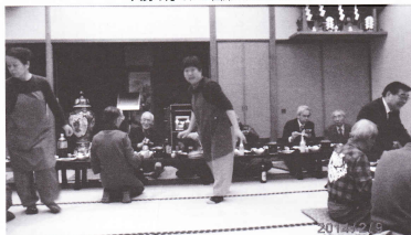
今年も盛大に行われました

をお迎えして盛大に行われました。前日の大雪に開催が危ぶまれましたが、好天に恵まれ、参加した50名の会員は相互の親睦を深め就業への新たな気持ちを養いました。