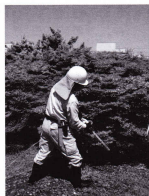
五月女親方による実演講習