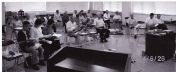
講義を熱心に聞き入りました