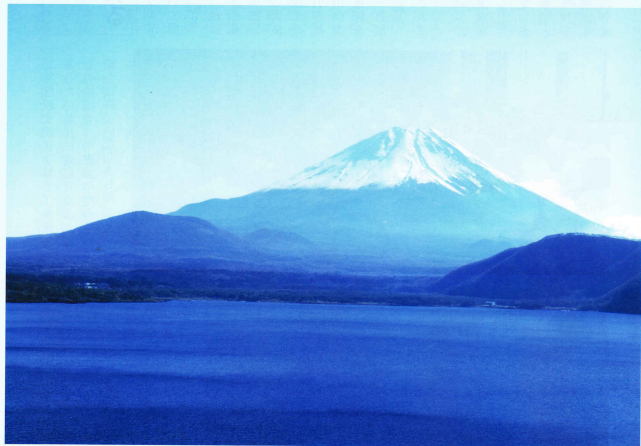
本栖湖より見た富士山

〒362-0806 埼玉県北足立郡伊奈町大字小室9454-1 TEL 048-720-5911 FAX 048-723-8755