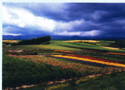
花景色 北海道富良野