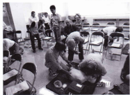
実技指導も真剣に