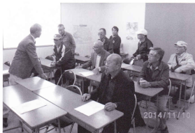
講義を熱心に受ける会員

講義の後、参加者は2組に分かれ、目の検査とスクールの喜藤教育指導員による自動車運転講習会を行い運転技能を見ていただきました。