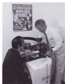
視野検査も大丈夫