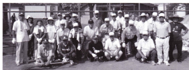
清掃が終わり、気分もスッキリ!