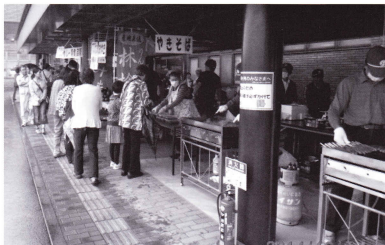
焼きそば・フランクフルトも好評で完売

10月5日(日)、ふれあい活動センターゆめくるで「ゆめくる祭」が行われました。空模様は雨となり来場者は例年より少ないようでした。 当シルバの会員は焼きそば・フランクフルト販売のお手伝いをし、好評を得て、完売することができました。