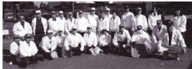
元気な会員達です

10月18日(土)、町役場周辺で恒例の清掃ボランティアを行いました。小春日和の皆さん頑張っていたいただきました。年を追うごとにゴミは少なく、環境はきれいになっています。参加された皆さんのお力で、当センターのアピールができたと思います。