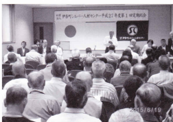
盛大に開催された総会

された理事会において正副理事長等も選任され、新たな役員体制が決まりました。 ※前期まで務められました役員の方々には、お疲れ様でした。