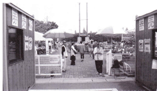
暑い中での券売・入園チェック

「ようこそ！バラの町 伊奈へ」と題し、5月9日から6月4日までの間、今年も町制施行記念公園バラ園において、町観光協会による「バラまつり」が盛大に開催されました。 物産展や花苗販売、ミニコンサート、ローズウェディング、ラ