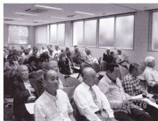
多くの方にご出席いただきました