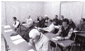
作業の安全を再確認

当日は、植木班親方の指導のもと、15名の会員が出席し、センター会議室での講習と樹木林でのノコギリやチェーンソーによる実践で汗を流し、作業の安全を確認しました。