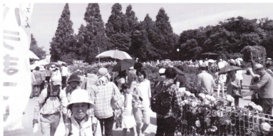
多くの来園者で賑わうバラ園

イトアップ等々様々なイベントの開催で会場を盛り上げました。期間中、会場では当シルバークの会員も入場券の販売、入園チェック等の仕事につき、町内外からの大勢のお客様の来園を笑顔でお出迎えしました。 暑い日差しの中での就業、お疲れ様でした。