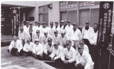
喜ばれるシルバーを目指して

昨年も、日頃からセンターを支援していただいている地域住民の方々や町行政に対し、その恩顧に配慮すること、センターの普及啓発を図るために多くのセンター会員が参加しての清掃ボランティア活動を行いました。 8月23日には伊奈まつり後の会場周辺、10月17日にはセンター、役場付近の道路や公園を中心に行いました。 今後も町民の皆様から喜ばれるシルバー人材センターづくりをすすめて参りたいと思います。