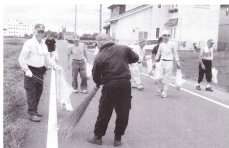
伊奈まつり花火会場周辺にて

昨年も、日頃からセンターを支援していただいている地域住民の方々や町行政に対し、その恩顧に配慮すること、センターの普及啓発を図るために多くのセンター会員が参加しての清掃ボランティア活動を行いました。 8月23日には伊奈まつり後の会場周辺、10月17日にはセンター、役場付近の道路や公園を中心に行いました。 今後も町民の皆様から喜ばれるシルバー人材センターづくりをすすめて参りたいと思います。