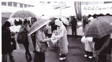
雨にも負けず呼び掛け（町総合文化祭）

11月8日（日）、「町総合文化祭」会場にて役員・地域班長等により、会員手づくりの貝のホルダーや折り紙を添えたチラシ、風船などを手渡し、入会案内や仕事の依頼について呼び掛けました。 また、翌週11月14日（土）には県民活動総合センターを会場とした「彩の国いきいきフェスティバル」に参加し、当シルバーとして、女性会員有志による手づくりの赤飯や会員による手芸品等の販売と共にチラシの配布などの啓発活動を行いました。 （携わりました女性会員有志の方、事業部会員、出品いただきました皆様、ありがとうございました。）