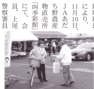
1人ひとりに交通安全を呼び掛け

11月10日、JAあだち野農産物直売所「四季彩館」にて、会員、上尾警察署員等、13名により反射材や啓発チラシを配布し、交通安全を呼び掛けました。