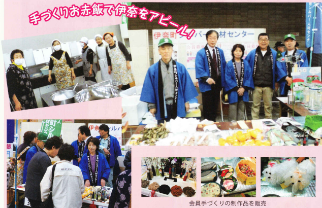
会員手づくりの制作物を販売