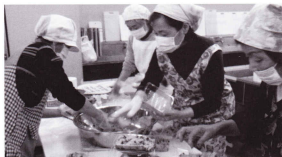
真心こめて赤飯づくり（彩の国いきいきフェスティバル）