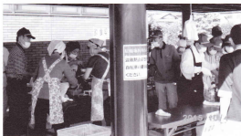
焼きそばづくりも手慣れたものです

10月4日(日)、ふれあい活動センター「ゆめくるで」が開催され、多くの方が来場する中、当シルバークラブがフランクフルトや焼きそば販売のお手伝いをし、好評を得ておりました。また、会場内の清掃にも従事するなど、会員さんも大活躍。お疲れ様でした。