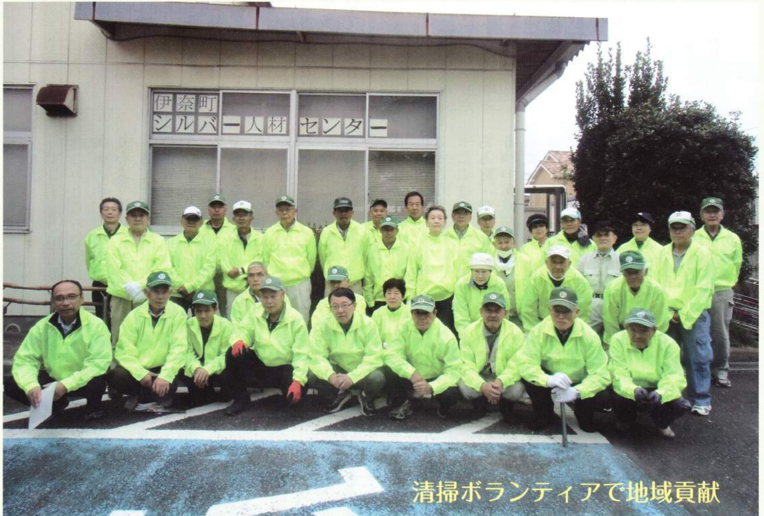
清掃ボランティアで地域貢献

公益社団法人 伊奈町シルバー人材センター 〒362-0806 埼玉県北足立郡伊奈町大字小室9454-1 URL : http://webc.sjc.ne.jp/inasc/ TEL 048-720-5911 FAX 048-723-8755