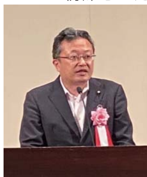
上野町議会副議長