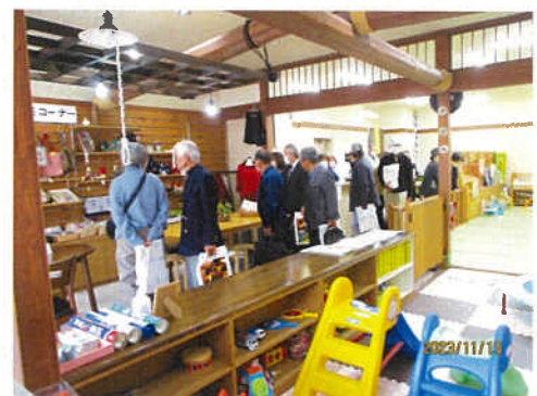
館内の展示販売コーナーや施設の見学

反響は少ないが地道に活動を実施している。入会者の8割が知人の紹介で2割がチラシによる入会。