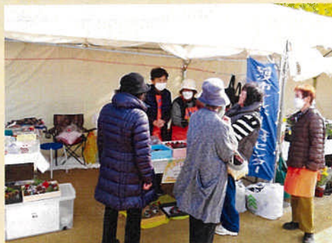
販売はお客様との語らいも楽しみのひとつです。