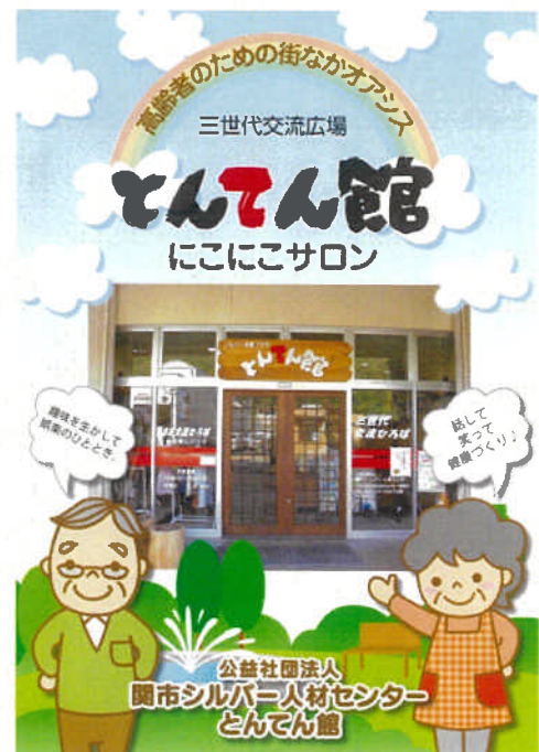
「とんてん館」を紹介するパンフ （→伝統産業の打刃の音から命名）