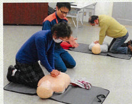
過年度の講習会の様子