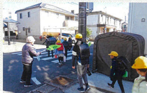
登下校の旗当番をする会員。依頼者から感謝の声が絶えません。