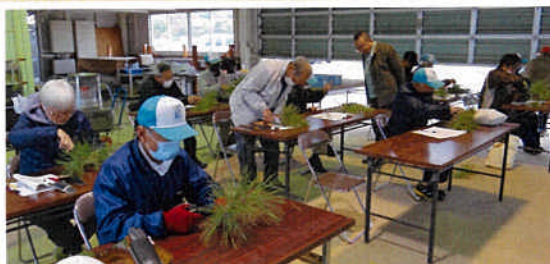
昨年度の講習会の様子