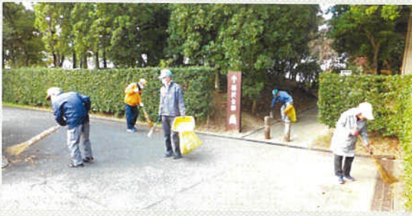
毎朝、稲沢市民公園を清掃する会員