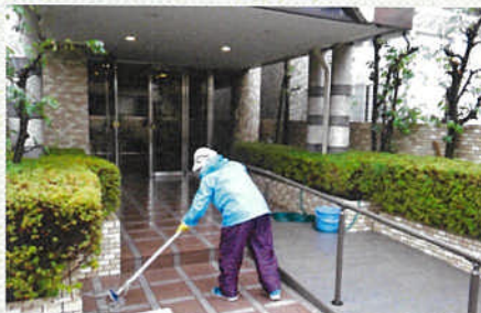
週2回、雨の日は、レインウエアーを着て、マンションを清掃する会員