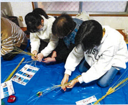
慣れない作業に四苦八苦しました

●<於：長野スクエア公民館>12月17日(日) 稲沢市社会福祉協議会の主催 子供を含め参加者 10人、講師(会員) 5人