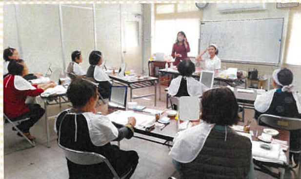
日頃の喧噪を忘れて、わが身に真剣に向き合いました！

女性会員から要望があったメイクアップ講習会を初めて開催しました。お化粧を落とすところから始まり、スキンケアの方法、パーソナルカラー（自分に似合う色）診断、メイクアップまで盛りだくさんの講習会となりました。鏡に映る自分の顔がみるみるうちにキレイになっていくのを目のあたりにして、参加者からは「どこが寄って帰ろうかしら？」「お父さんに見てもらおうの楽しみだわ！」との声が聞かれました。メイクによって身も心もキラキラした様子でした。