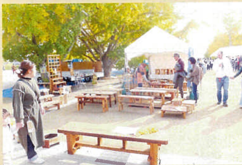
売約済もあり多くの品が売れました。