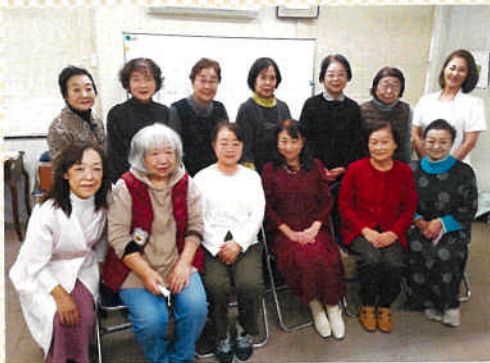
笑顔でいっぱい会員受講者