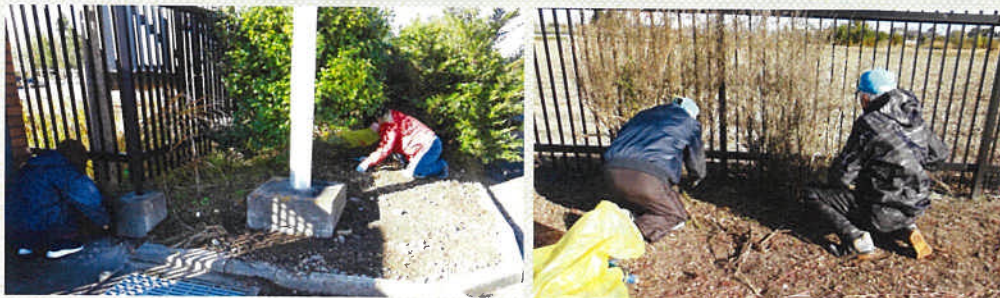
気温の低い朝、三宅浄化センターの敷地を除草する会員