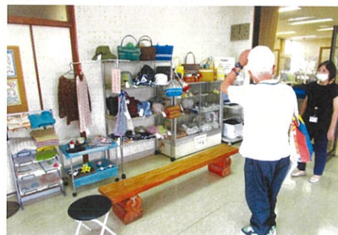
展示作品の説明を聞く