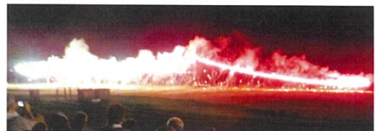
フィナーレを飾る「ナイアガラの花火」