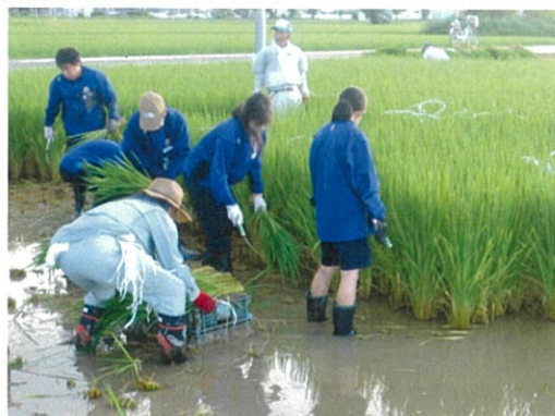
会員の手ほどきで青田刈りをする中学生