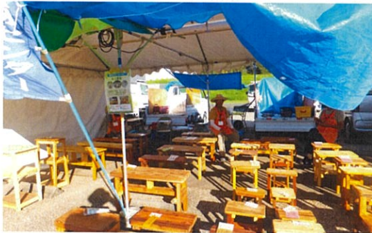
木工品の展示販売

8月26日(土)「稲沢夏まつり」がサリオパーク祖父江で開催されました。川面に向かって心地よい風が吹きわたり酷暑の一時を忘れるような中、広大な会場では本センターの木工部会が出店しました。夜7時30分から打ち上げ花火が行われ、会場や堤防の土手は観客で埋め尽くされました。