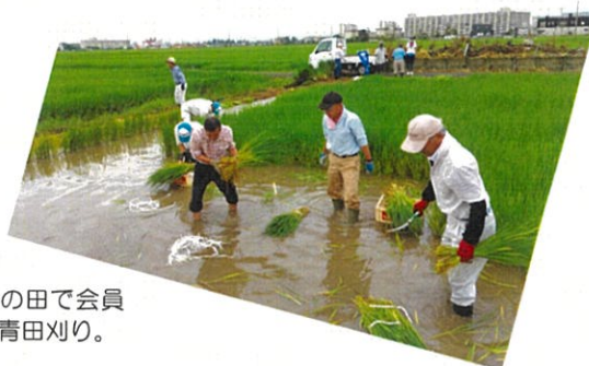
2か所の田で会員による青田刈り。