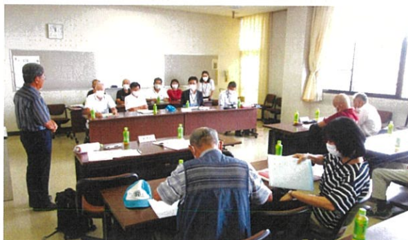
研修会で挨拶する会長

8月31日（木）猛暑のなか、本センターの「安全・適正就業委員会」のメンバーが、令和5年度安全就業優秀シルバー人材センターに選ばれた刈谷市シルバー人材センターへ視察に伺いました。この日は知多市シルバー人材センターの役員の皆さんも視察に来られ、3センターでの意見交換会となりました。それぞれのセンターの現状や安全就業への対策等を聞くことができ、有意義な視察となりました。