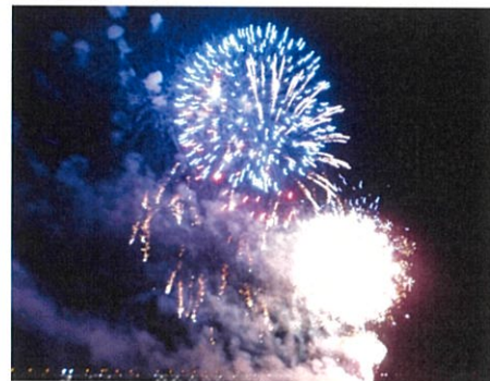
夜空高く打ち上げられた花火に歓声が沸き起こる

8月26日(土)「稲沢夏まつり」がサリオパーク祖父江で開催されました。川面に向かって心地よい風が吹きわたり酷暑の一時を忘れるような中、広大な会場では本センターの木工部会が出店しました。夜7時30分から打ち上げ花火が行われ、会場や堤防の土手は観客で埋め尽くされました。