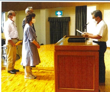
優秀標語作品者の表彰

令和5年度 交通安全講習会 期日: 8月9日(水) 場所: 稲沢市勤労福祉会館 ～「安全就業標語」・「交通安全標語」優秀作品の表彰も併せて実施しました～