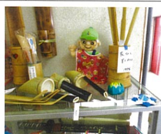
展示案内と竹細工の品々