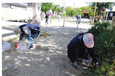
参道のゴミを拾う会員