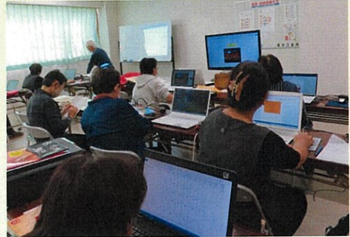
思考を巡らしながらパソコン操作

パソコン操作に慣れれば、楽しい世界が待っています。 ご参加をお待ちしております！