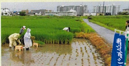
昨年の青田刈り作業

日 程 ： 稲の発育状態によって決定 (令和4年度は8/18～実施) 時 間 ： 午前5:30 作業開始～午前9:30 頃 場 所 ： 稲沢市高御堂4丁目・5丁目地内 作業内容 ： 田んぼでの青田刈り 刈った稲を干す作業など 配 分 金 ： 時給1,029円