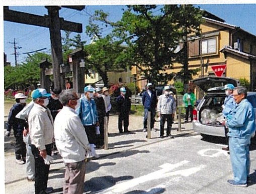
活動参加者へお礼を述べる会長

今年度から「桜まつり」後の清掃活動を「植木まつり」後の活動へと変更しました。会員16人の参加があり、活動後にはゴミのないきれいな参道になりました。