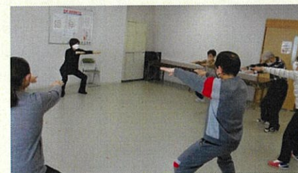
講師の明るい掛け声とBGMに合わせて