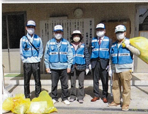
活動を終了した奉仕活動委員