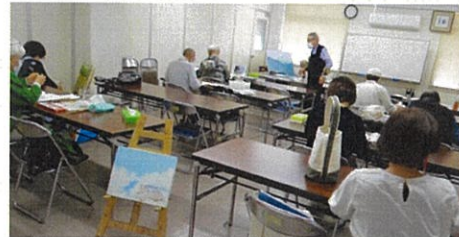
絵描きには、軽いBGMが欠かせません。