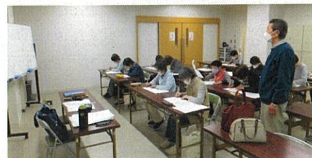
仲間がいて、落ち着いた気持ちが上達に！