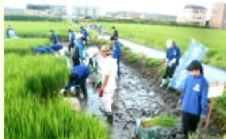
昨年の青田刈り作業 (中学生の特別参加)

日 程 ： 稲の発育状態によって決定 (令和5年度は8/18～実施) 時 間 ： 午前5:30 作業開始～午前9:30 頃 場 所 ： 稲沢市高御堂4丁目・5丁目地内 作業内容 ： 田んぼでの青田刈り 刈った稲を干す作業など 配 分 金 ： 時給1,073円