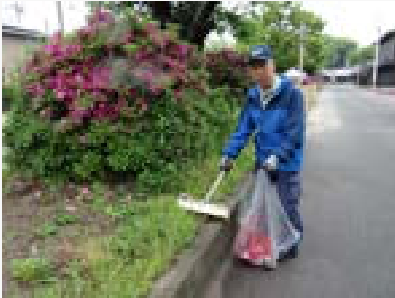
参道のゴミを拾う会員