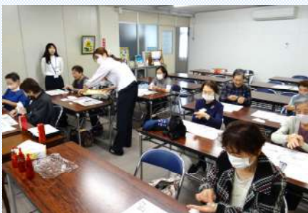
化粧水の浸透チェック