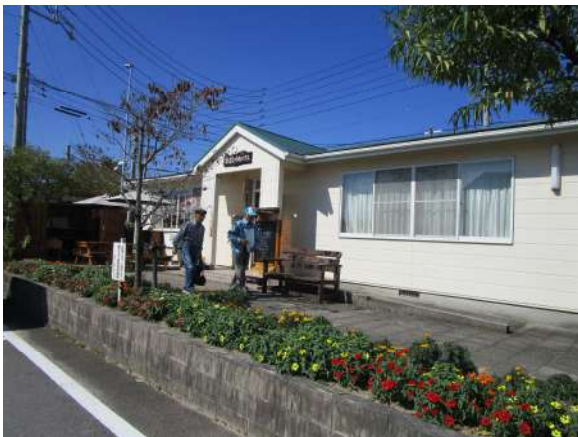
活動拠点の『幸齢ゆめハウス』