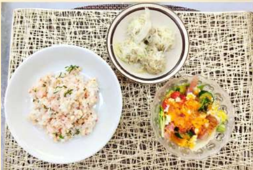
出来上がったおいしそうなお料理