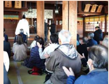
昨年の安全祈願の様子