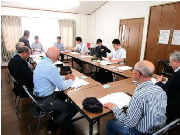
研修会で挨拶する会長