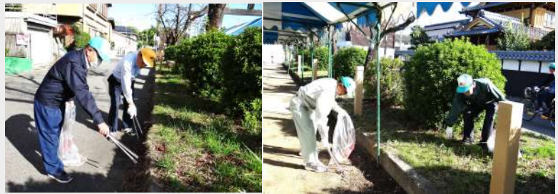
ゴミ拾い活動をする会員

奉仕活動への参加者も集合予定時間を待たずに、環境美化へとゴミ拾い活動が始まりました。