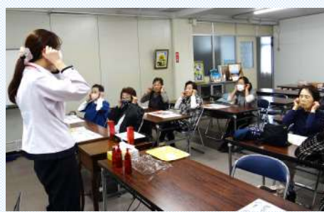
血行促進へと耳つぼマッサージ