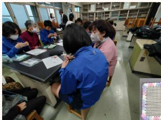
「手芸（編み物）」作り／缶・ボトルオープナー