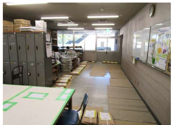
仕分けされた広報等の配布物