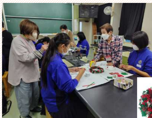
「クリスマスリース」作り