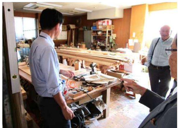
木工作業所の視察