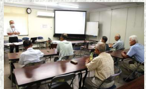
第1回の講座の様子

75歳以上の方が、運転免許証の更新時に認知機能検査（義務）を受けるためのものです。