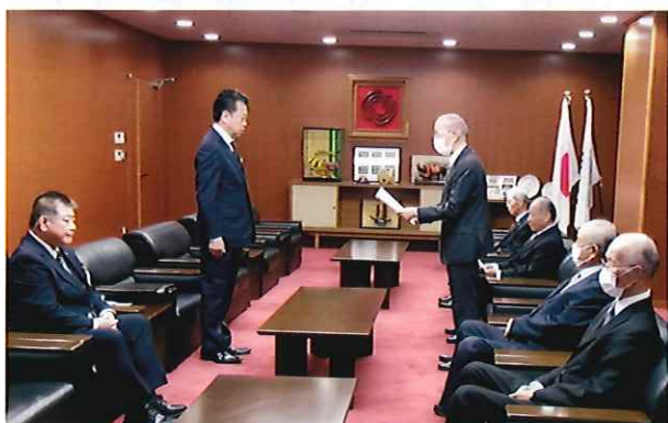
大久保市長への要請