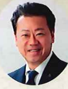
諫早市長 大久保 潔重