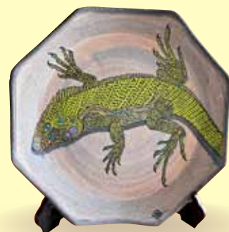
左/月の砂漠 右/イグアナ (陶芸作家展 秀作賞)