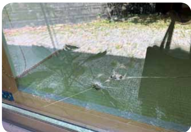
飛石により建物の窓ガラスを破損させた