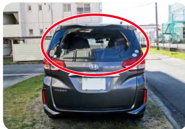
飛石により隣地に駐車してあった車の後部窓ガラスを破損させた