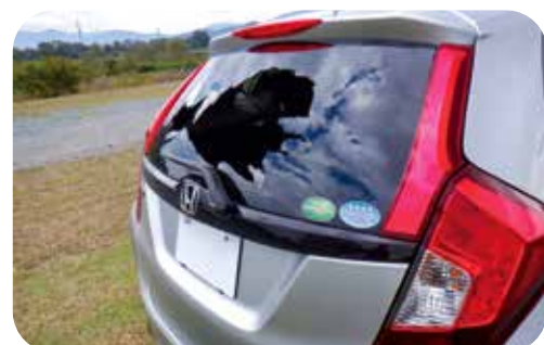
飛石により駐車中の車の リヤガラスを破損させた