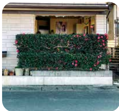
飛石により道路を隔てた美容院の ウィンドウガラスを破損させた