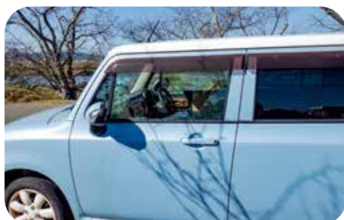
飛石により駐車中の車の 助手席側ドアガラスを破損させた