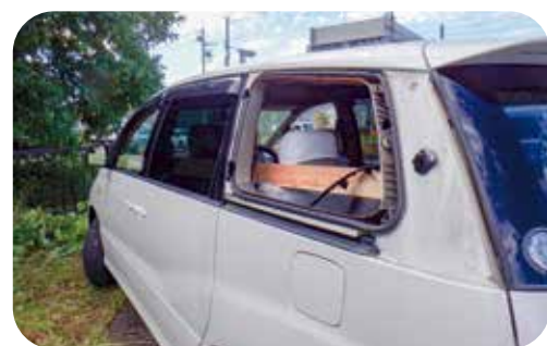
飛石により走行中の車の 後部左側ガラスを破損させた