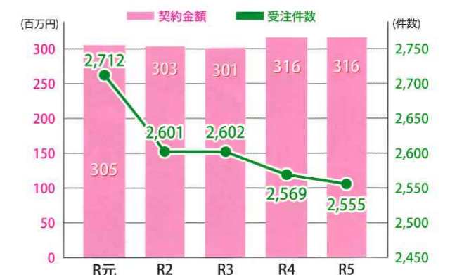
《契約金額・受注件数の推移》

受注件数は減少しているものの、就業実人員は増加しています。配分金・契約金額は、公共事業はコロナ対策の小中学校施設消毒業務の終了により減少していますが、民間事業所、一般家庭、独自事業、派遣事業は増加しています。