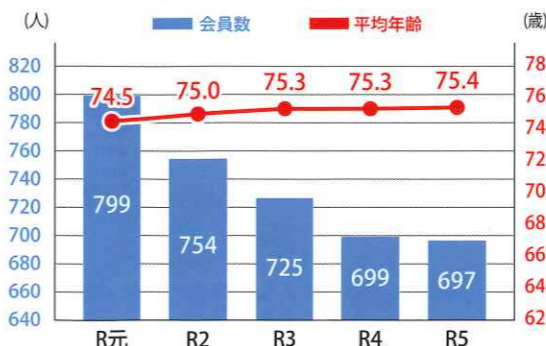
《会員数・平均年齢の推移》

会員の平均年齢は、前年度とほぼ同じで高齢化の進行は鈍化しています。また、植木の剪定や刈払機による除草、障子や襖の張替え、刃物研ぎなど、技能・技術を要する作業を行う会員が減少しつつあります。