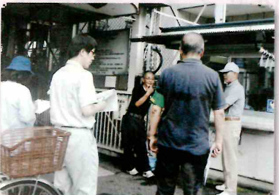
駅南口 / 駐輪場管理

リサイクル資源選別作業 ：リサイクル資源には危険な物が混入しているため注意して選別しています。