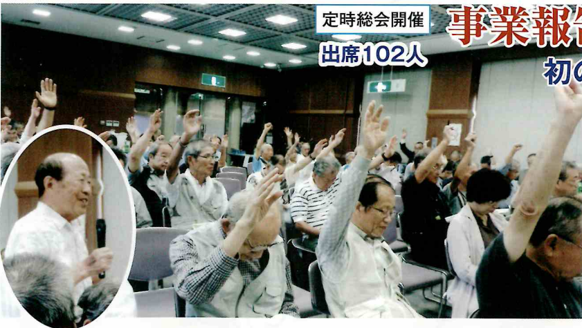
定時総会開催 出席102人

「誰もが明るく暮らせるまちづくり」としての皆様のご活躍を心よりお祈り申し上げます。