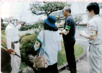
吉野工業 / 植木剪定