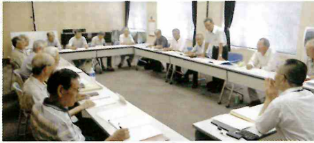
地域班班長・副班長 会議風景 平成23年6月24日(金) シテイプラザ

平成21年6月に発足した地域班においては、各班連絡員のご努力により会報の配布やお知らせが各会員宅に直接、届けられました。 また、各班長の主導のもとに、地域での口コミによるセンター事業のPR、緑花まつり時にセンターのチラシ配布や緑化募金活動に協力、また、あやめまつり等にボランティアとして参加、さらに新規就業の開拓などの地域班活動が行われました。