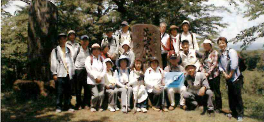
ハイキング(第25回) 鳶尾山～八菅山コース H23・5・25(水) 参加者21人