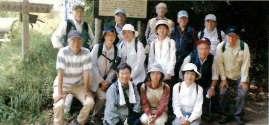
史跡めぐり(第15回) 新緑の矢倉沢往還コース H23・6・4(土) 参加者15人