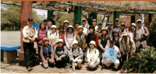
ハイキング(第24回) 湘南平～大磯コース H23・4・26(火) 参加者30人