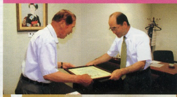
H21.7.17当センターの発展のために 全品の寄付をいただき、感謝状が贈られました。