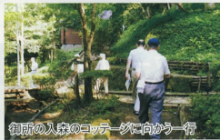
御所の入森のコテージへ向かう一帯