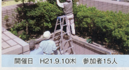
開催日 H21.9.10日 参加者15人