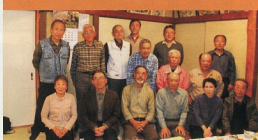
H21.4.6日 とん吉にて開催