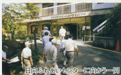
日向ふれあいセンターに向かう一帯