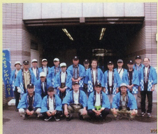
ご協力ありがとうございました