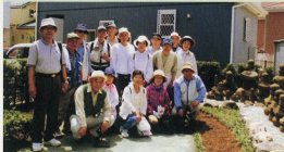
史跡めぐり⑩ H21.6.20日 車橋・坪の内コース 参加者17人