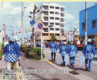
実施日 平成21年10月3日(土)・4日(日) 参加者 延べ65人