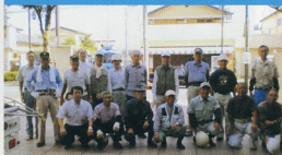
開催日 H21.9.10日 参加者15人