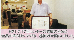
H21.7.17当センターの発展のために 全品の寄付をいただき、感謝状が贈られました。