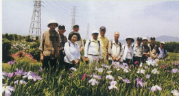
ハイキング⑪ H21.6.27日 あやめの里コース 参加者12人