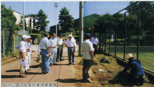
鈴川公園の除草作業視察風景