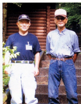
伊勢原市 原バーシ ルバー 人材セ ンター は、今 年から

新たに指定管理者となった伊勢原市森林組合から、市内日向地区にある宿泊コテージ施設「通称森のコテージ」の営業管理業務を受注しました。