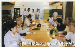
日向ふれあいセンターでの報告会