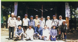
史跡めぐり⑨ H21.4.26日 伊勢原駅周辺コース 参加者15人