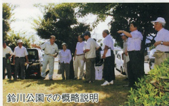
鈴川公園での概略説明