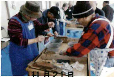
11月21日 刃物研ぎ・障子張り講習会 八幡台作業所2階にて (14人が参加)