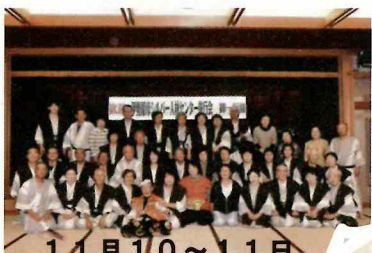
11月10～11日 シルバー旅行会 秋の紅葉 上高地飛騨高山の旅 (43人が参加)