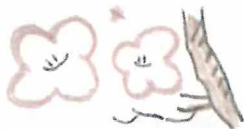
4/16予定 花火大会翌朝会場清掃 班長 蒔田礼次郎さん 大山・高部屋班

冷え込む川床に12人長靴で活躍。「今年もみんなで楽しくやりました」班長 飯島通洋さん 大田班